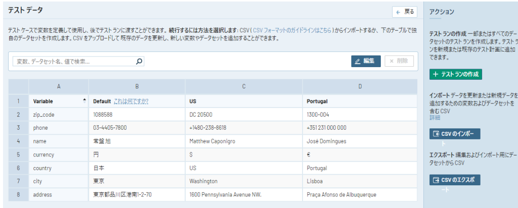
図 1：変数に渡す値をパラメータ化