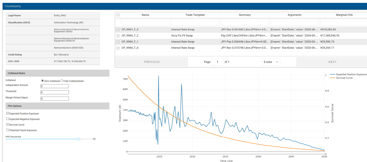
無担保取引でのCVA/DVA及びマージナルCVA

◇マージナルCVAは、カウンターパーティごとにネットティングを考慮して算出されたCVA/DVAを、各取引に按分した値となります。マージナルCVAを算出することで、どの取引がCVAに大きく影響を与えているか確認することができます。「F3 CVA試算/計測サービス」では、無担保取引のみならず、当初証拠金及び信用極度額・マージンピリオドを考慮した上でのマージナルCVAを算出します。