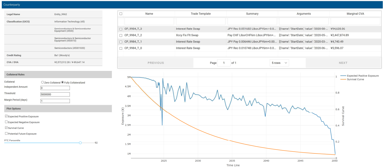
信用極度額(¥5,000,000)とマージンピリオド(1日)を設定した場合のCVA/DVA及びマージナルCVA