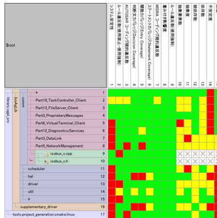
図 1. メトリクスやルール違反数などを色で可視化するヒートマップ表示機能