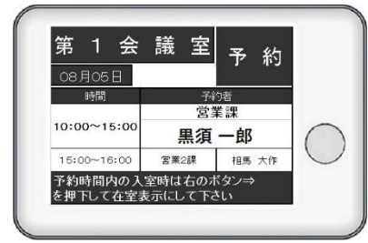
電子ペーパー式の部屋パネル

これまでの会議室予約システムは、部屋パネルがタブレット端末方式であることが多く、カラーが目立つ代わりに、多機能で操作が煩雑となり、とても高額となるケースが多く見られました。OSの不具合や機器の盗難リスクに対応するためのバージョンアップやセキュリティ対策に加え、電源工事なども必要で、導入・運用にお金と時間と労力を要しました。