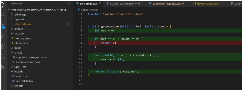
図 2. VS Code 上でのカバレッジ取得結果の表示